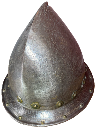
Yelmo de infantería