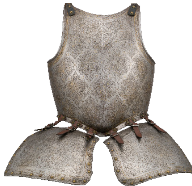
Peto y dos escarcelas