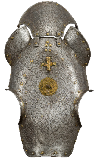
Yelmo para caballo